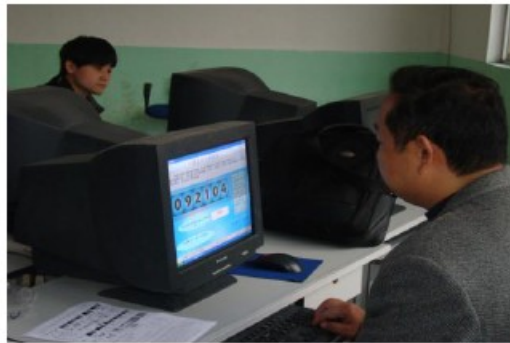
实验学生的家长会